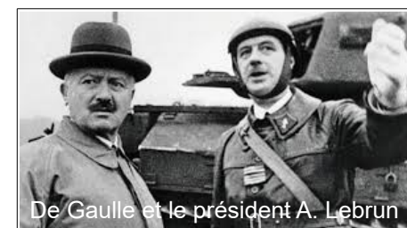
De Gaulle et le président A. Lebrun