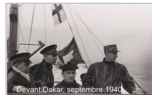
Devant Dakar, septembre 1940