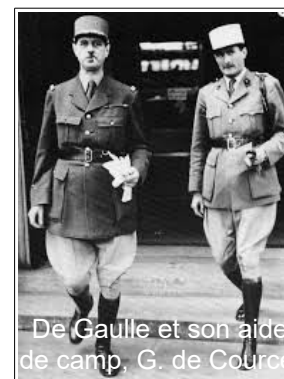
De Gaulle et son aide de camp G. de Courcel