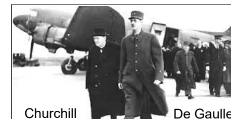
Churchill De Gaulle