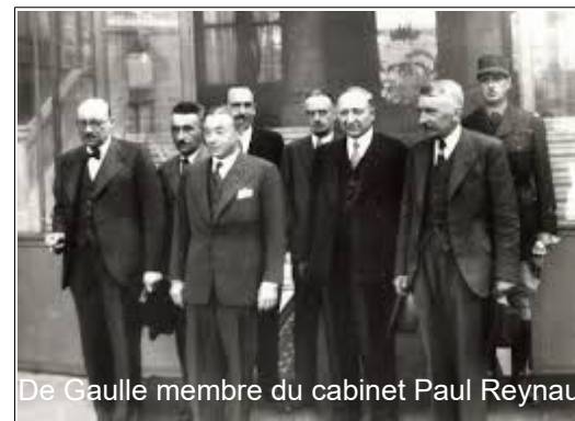
De Gaulle membre du cabinet Paul Reynaud

C'est l'histoire, souvent mal connue ou simplifiée de ces quelques semaines à l'issue desquelles de Gaulle entra dans la légende, qu'évoquera le conférencier.